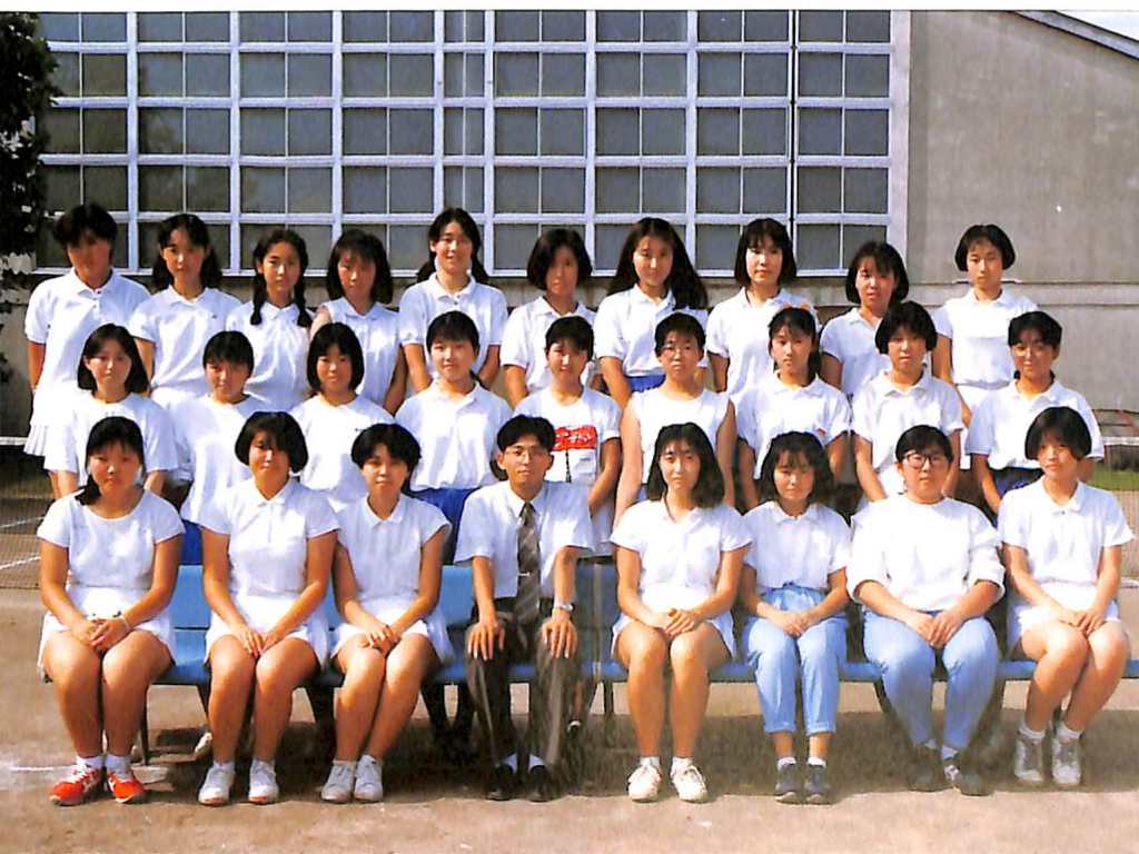
剣道部 陸上部 テニス部(男子) テニス部(女子) 柔道部 応援団 ソフトボール部